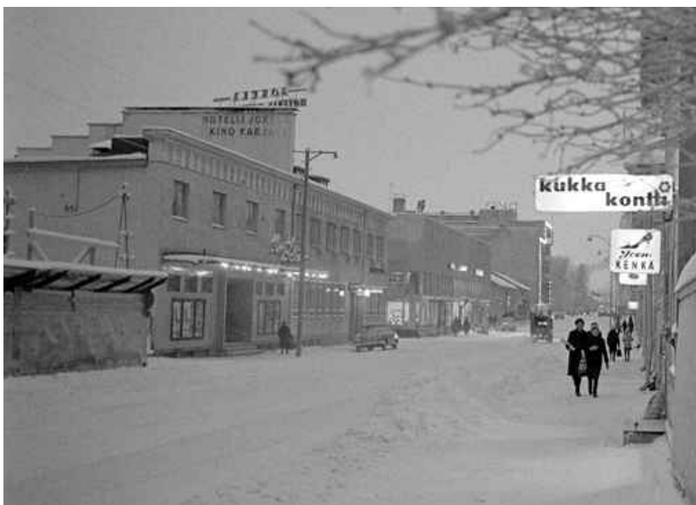
Pinnoitetta lukuun ottamatta ennallaan

Suunnittelija on taitavasti niveltänyt rakennuspaikalla valmiina olleen puurakennuksen osaksi isompaa kokonaisuutta. Kino Karjala – Vanha Jokela -rakennuskompleksissa voikin nähdä sotia edeltävän ajan funkiksen pelkistetyin muotokielen. Rappaus katonrajan ornamentteineen viimeisteli julkisivusta yhtenäisen ja komean kokonaisuuden.