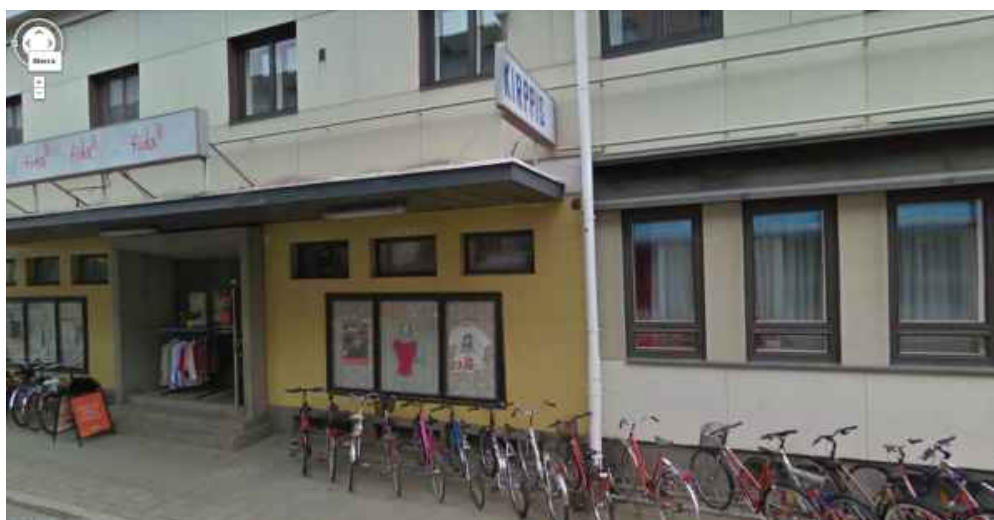
Elokuvateatterin sisäänkäynti

Elokuvateatteri ja hotelli-ravintola on rakennettu yhtenäiseksi kokonaisuudeksi. Kivirakennuksen ja hirsirunkoisen rakennuksen raja on kuvan keskellä näkyvän syöksytorven kohdalla. Kino-Karjalan kiviseinä on syöksyrännistä vasempaan ja Vanhan Jokelan hirsirunkoinen seinä oikeaan. Teatterin sisäänkäynti on säilynyt ennallaan ja jopa elokuvajulisteiden lasikot ovat vielä paikallaan. Lipan alapuolella oleva seinä on laatoitettu.