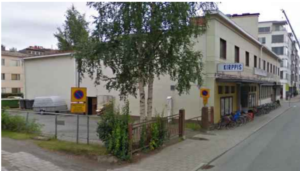
Elokuvateatterin sivuprofili.

Näkymä Yläsatamankadun suunnasta. Kino Karjalan elokuvakatsomon katto laskeutuu sisäpihalle päin. Varapoistumistie näkyy liikennemerkkin vieressä. Katon kadunpuoleinen pää on mustaa huopakatetta. Sisäpihan puolella on peltikate. Huopakatteen kunto olisi pikimmiten tarkistettava.