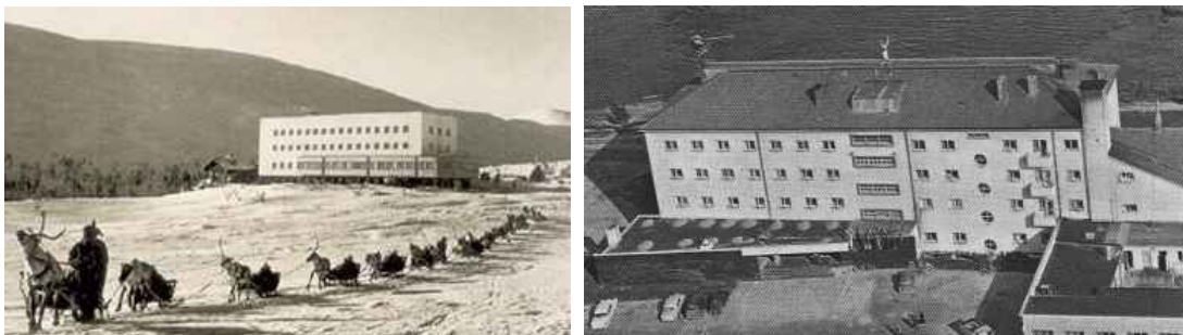
Pallaksen tunturihotelli ja uusi Pohjanhovi