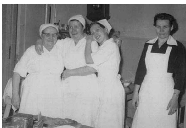
Ravintola Jokelan interiööri ja keittiöhenkilökuntaa vuosikymmenten takaa.

Kino Karjala ja Vanha Jokela muodostavat paikallishistorian, kulttuurihistorian ja rakennushistorian kannalta ainutlaatuisen kokonaisuuden. Merkittävänä voidaan pitää myös hotelli-ravintolan runsaat 70 vuotta jatkunutta toimintaa. Suomen oloissa tämä edustaa poikkeusta säännöstä. Maassamme on vain muutama ravintola, jota ei olisi muutaman vuoden välein huonolla maulla modernisoitu. Nämä harvat poikkeukset ovatkin sitten saavuttaneen kansallista mainetta. Suorastaan jääräpäinen perinteiden vaaliminen on johtanut siihen, että Joensuun kuuluisin ravintola on juuri Vanha Jokela.