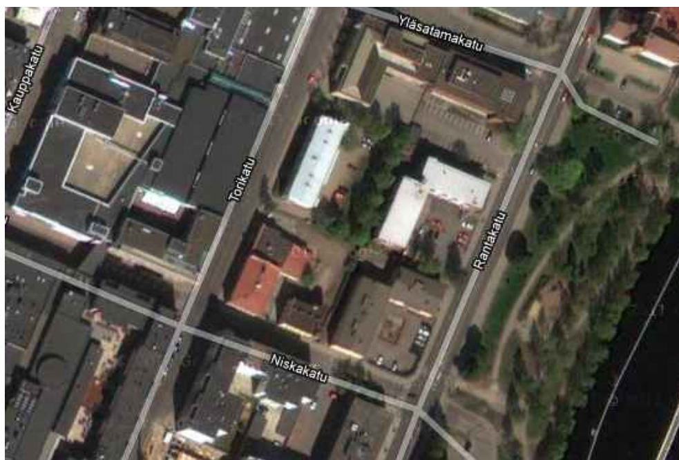
Ilmakuva kohteesta

Kohde sijaitsee Niskakadun ja Torikadun kulmauksessa. Hotelli-ravintola Vanha Jokela sijaitsee kadunkulmasta Yläsatamakadun suuntaan (kokonaan punainen peltikatto). Kino Karjalan kiinteistö on poikittain ravintolasiiven jatkeena (katua vasten musta huopakatto, jatko-osassa punainen peltikatto). Palomuuuri heittää varjon elokuvateatterin katolle.