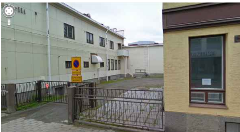
Hotelli-ravintola ja elokuvateatteri takapihan puolelta kuvattuna

Takapihan nurkkauksessa on hotellin sisäänkäynti, josta oikeaan jatkuu elokuvateatteri katsomo-osa. Sisäänkäynnistä kadulle päin on alakerrassa keittiön ikkunat ja yläkerrassa hotellihuoneiden ikkunoita. Sisäpihan puolella on kaksi kellareihin johtavaa ovea. Etummaisena vieressä oleva ovi johtaa kellariin, jonka seinät muodostuvat kivilatomuksista. Taaempi, keittiön ikkunan alapuolella oleva ovi avautuu betonirakenteiseen kellariin.