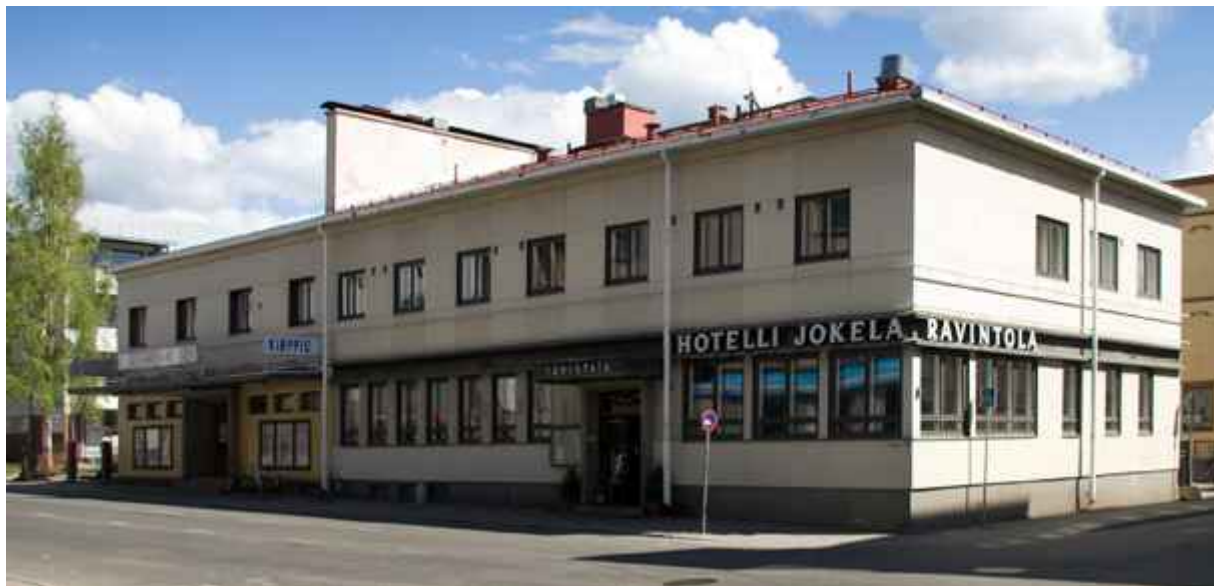
Jämäkkä rakennus.

Kiinteistökokonaisuus Niskakadun ja Torikadun risteyksen yli kuvattuna. Vanhoille puukaupungeille ominaiseen tapaan rakennuksen osat on erotettu palomuurilla toisistaan. Muurin tarkoitus oli rajata tulipalon aiheuttamat vahingot vähimpään mahdolliseen. Räystäslinjat ovat suorina. Rakennuksen ulkonäkö on seinäpinnoitetta lukuun ottamatta säilynyt ennallaan. Rakennus on pinnoitettu mineriitilevyllä arvatenkin 1960-luvulla. Levyn alta löytyy alkuperäinen rappauspinta.